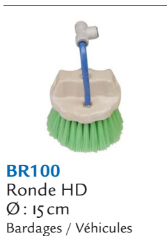
BR100 Ronde HD Ø: 15 cm Bardages / Véhicules