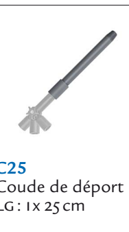
C25 Coude de départ LG: 1 x 25 cm