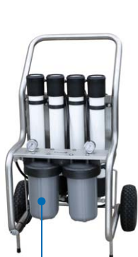
M150 - 1 utilisateur HT*LG*LRG: 105 x 45 x 60 cm Poids: 42kg