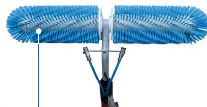
PROG - Brosse motorisée Brosses Ø: 15 cm Panneaux photovoltaïques et solaires