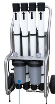
M300 - 1 à 3 utilisateurs HT*LG*LRG: 120 x 65 x 65 cm Poids: 68 kg