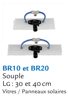
BR10 et BR20 Souple LG: 30 et 40 cm Vitres / Panneaux solaires