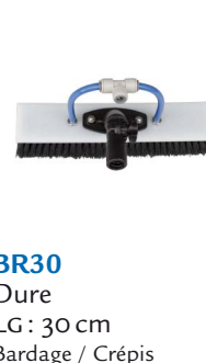
BR30 Dure LG: 30 cm Bardage / Crépis